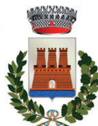
COMUNE DI ORTONA