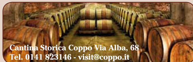
Cantina Storica Coppo Via Alba, 68 Tel. 0141 823146 - visit@coppo.it