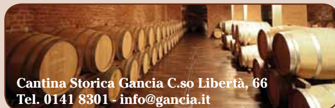
Cantina Storica Gancia C.so Libertà, 66 Tel. 0141 8301 - info@gancia.it