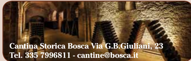
Cantina Storica Bosca Via G.B.Giuliani, 23 Tel. 335 7996811 - cantine@bosca.it

Visita alle Cattedrali Sotterranee di Canelli e ai paesaggi vitivinicoli Patrimonio Mondiale dell'Umanità: